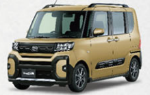
タントファンクロス