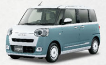
ムーヴキャンバス