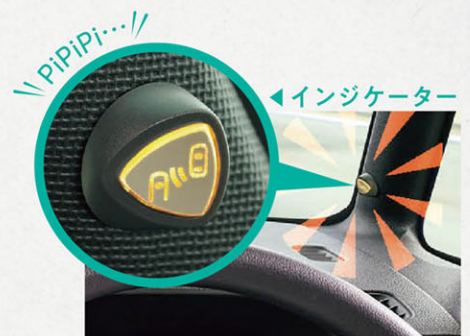
※写真はタントの物となります。

車両後方の死角領域を走る車両を検知する安全機能で、ピラーに設置したインジケータが点灯、または点滅とブザー音で危険を知らせます。危険を知らせる機能には、 ①BSM(ブラインドスポットモニター) 、 ②RCTA(リヤクロストラフィックアラート) 、 ③DOW(ドアオープンワーニング) の3つがあり、様々なシーンで安全・安心をサポートします。