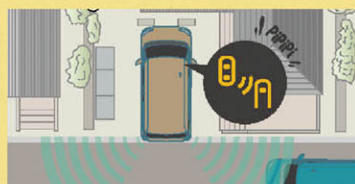
後退時:後方接近車両の検知

後方を横切る車両を検知し、インジケータの点滅、ブザー音により注意喚起を行い、後退時の安全確認を補助します。